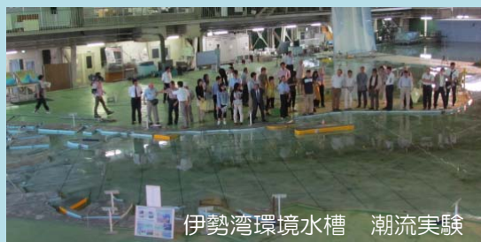
伊勢湾環境水槽 潮流実験