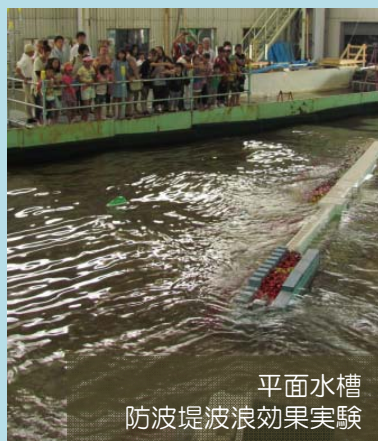
平面水槽 防波堤波浪効果実験