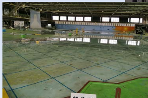
伊勢湾水理模型実験センター

名古屋港湾空港技術調査事務所 名古屋市南区東又兵衛町1丁目57-3 ★JR東海道本線 笠寺駅から徒歩10分